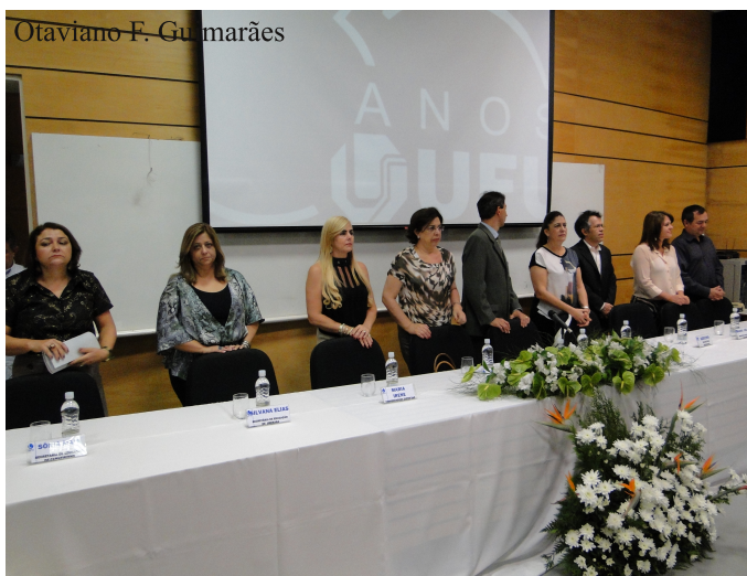
Mesa de diretores e professores homenageados

O curso busca formar professores para atuar na área da educação. É destinado à formação de professores que já exercem a docência na educação básica e não possuem nível superior. Na perspectiva da formação inicial, o curso também oferece oportunidade para aqueles que se interessam pela área da educação e nunca atuaram na docência. A duração do curso é de 4 anos/8 semestres, com regime acadêmico semestral.