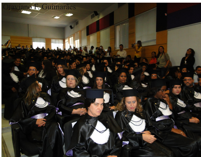
Formandos em Pedagogia 2013 - CEaD UFU