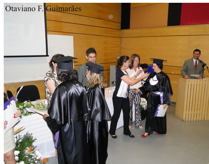
Alunas recebendo o tão sonhado diploma